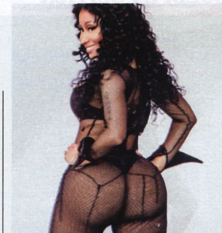
Sopra, Nicki Minaj, cantante volgare e ammirata. Sotto, l'attrice spagnola Ester Expósito balla El Efecto : una coreografia molto amata su TikTok.

Ma a sentire Matteo Lancini, che ogni giorno si occupa dei problemi di questa generazione, è tanto fumo e poco arrosto. «Erotizzano, precocizzano, espongono il corpo in maniera esagerata secondo i nostri canoni, ma è un atteggiamento più scenico che intimo» spiega. «Risulta ci sia molto più sexting, con l'invio di immagini, che sesso. È la loro caratteristica distintiva. È una sessualità che potremmo definire narcisistica e che non corrisponde all'idea di chi appartiene a generazioni passate, quando nella società più sessuofobica si cercavano atti proibiti. Il rovescio della medaglia è che mentre pensano di essere già grandi, può capitare che quelle immagini girino, e la cosa sfugga di mano. Si diventa popolari nel modo sbagliato. Mortificati, ci si può vergognare di essere al mondo. Gli adulti che li mettevano al centro di tutto, adesso non dimentichino questi rischi».